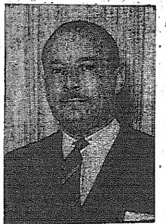
طار يارينغ الى نيقوسيا